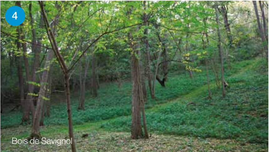
Bois de Savignol