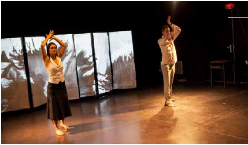
Séance de répétition à la ferme du Cavalie

à une double volonté : transmettre les œuvres du répertoire classique au public sourd qui n'y a pas accès, et sensibiliser le public entendant à la dimension artistique de la langue des signes. Car cette langue, au même titre que les autres formes telles que la danse ou le chant, est un outil d'expression artistique. »