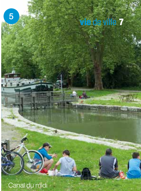
Canal du midi

Maison éclusière et Aqueduc du Perrier. Entretien réalisé par les Voies Navigables de France Inscrit à l'inventaire du Patrimoine mondial de l'Unesco.