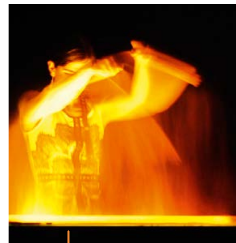
Des rêves dans le sable