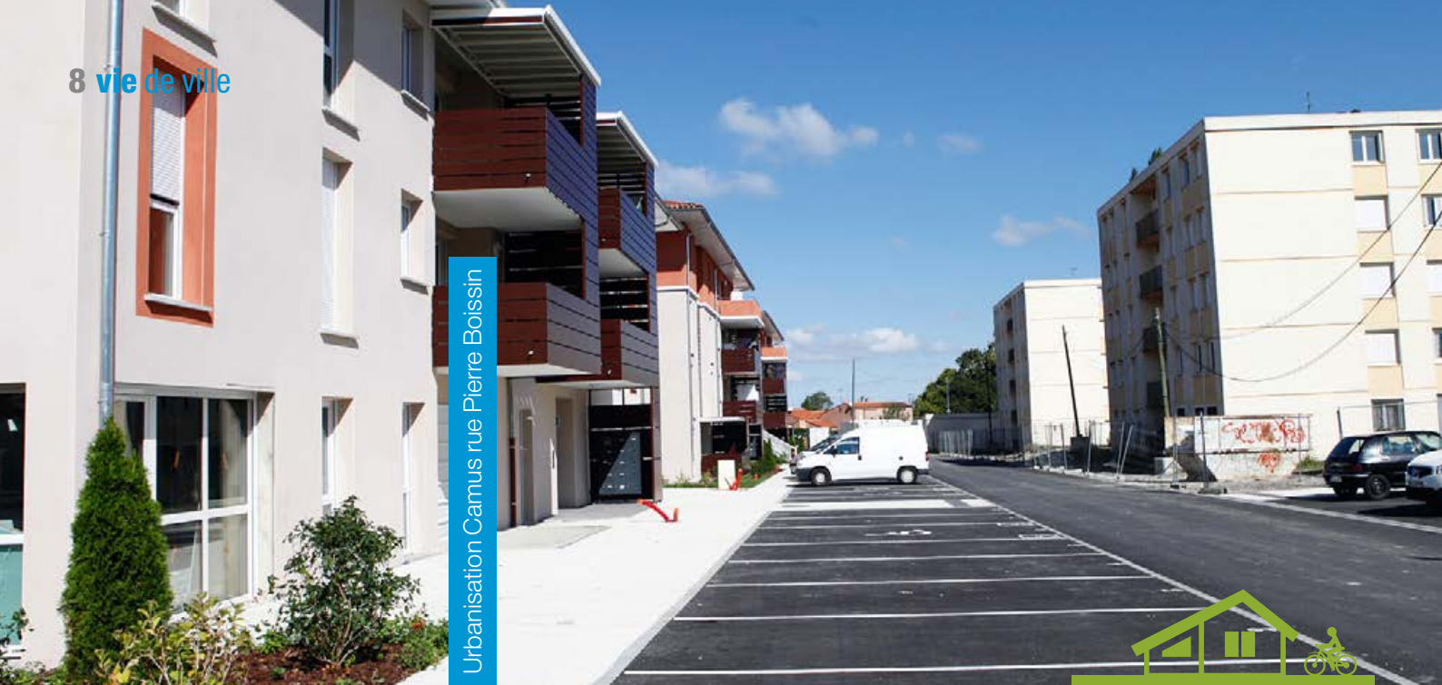
Urbanisation Camus rue Pierre Boissin