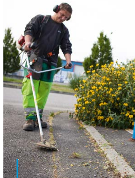
Utilisation du réciprocoator